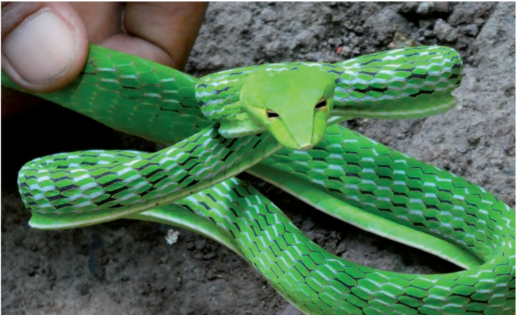
Fig. 7. TABU, een slang gevonden langs de Ciliwung Rivier. TABU, a snake found along the Ciliwung River.