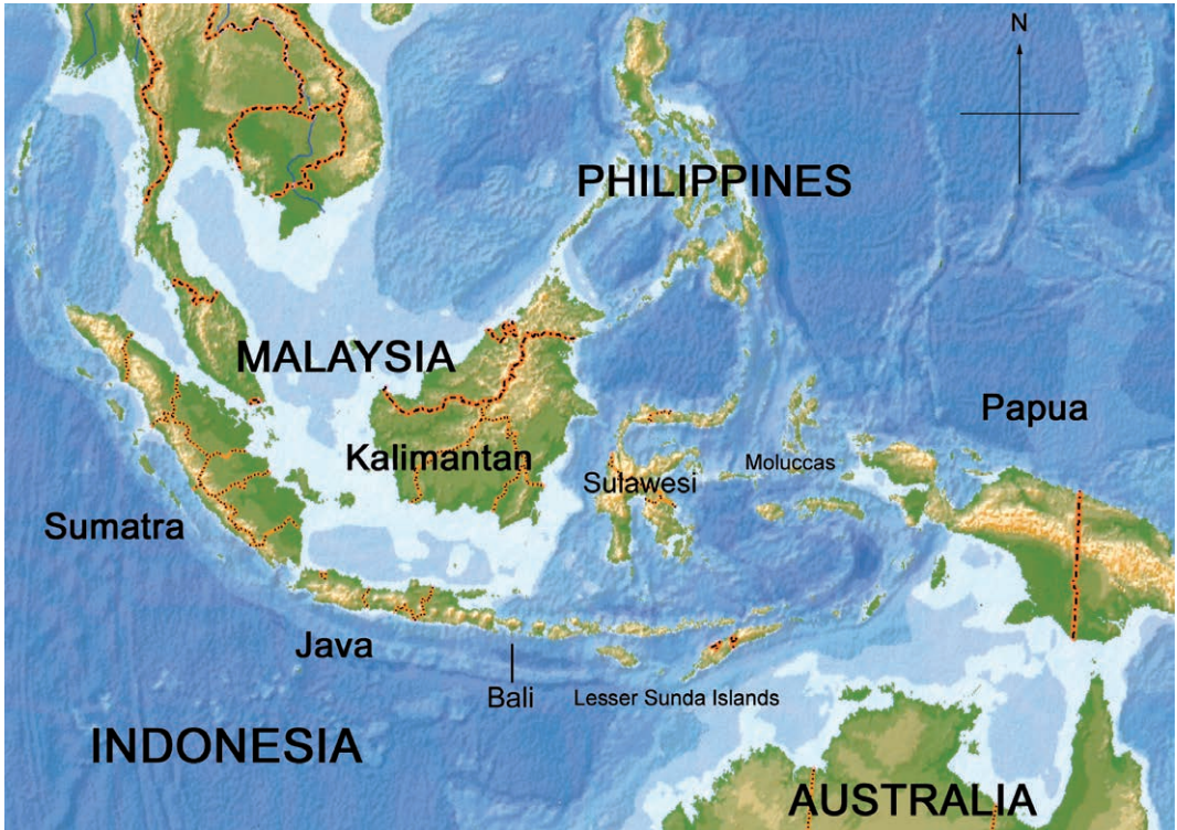
Fig. 1. Kaart van Indonesië Map of Indonesia