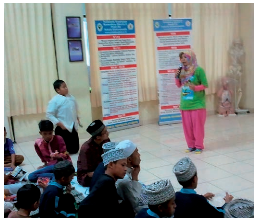
Fig. 3. Een schoolklasbijeenkomst georganiseerd door SSRT in Depok, West Java A school class meeting organized by SSRT in Depok, West Java