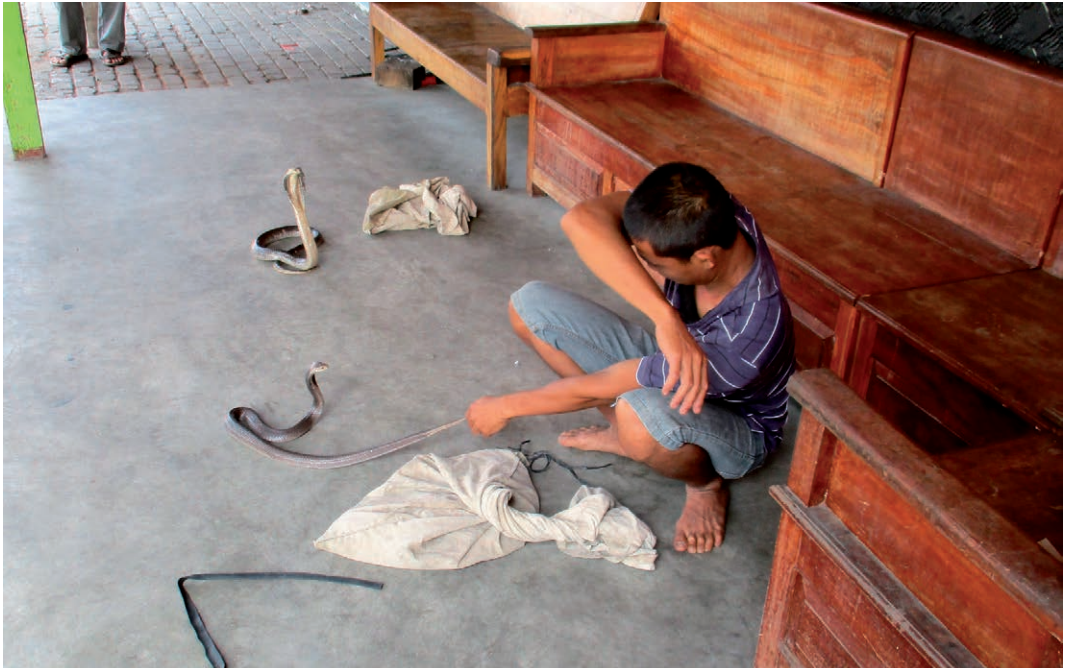
Fig. 9. Een slangenhandelaar in Midden Java laat zijn Javaanse spugende cobra's zien. A snake trader in Central Java shows his Javanese spitting cobras.

cate local people (see Figure 3 and 4). The Snake Learning Park in Depok, West Java takes people to snake habitats and informs them how to go about with snakes and tells them that they certainly don't need to kill snakes (see the Figures 5, 6 and 7). They also remove snakes from houses. The Bali