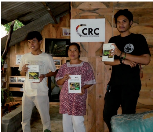
Fig. 2. Het onderkomen van CRC in Bogor, West Java. Medewerkers tonen slangenboeken van de auteur. The home of CRC in Bogor, West Java. Employees show snake books from the author.