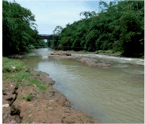
Fig. 5. Een slangenhabitat van TABU op de oevers van de Ciliwung Rivier, West Java. A snake habitat of TABU on the banks of the Ciliwung River, West Java.

De Indonesische Herpetologische Vereniging heeft tot doel herpetofauna's te bestuderen en te beschermen, geeft een tijdschrift uit en organiseert bijeenkomsten. Het Ciliwung Reptielencentrum in Bogor, West-Java, probeert door onderwijs de bescherming van amfibieën en reptielen te verbeteren (zie Figuur 2). Het Sioux Slangenreddingsteam in Depok, West-Java, vangt slangen die in huizen zijn binnengekomen en zet ze terug