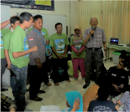
Fig. 4. De auteur spreekt de schoolklas toe in zijn beste Indonesisch. The author addresses the school class in his best Indonesian language.